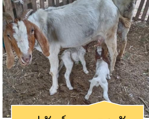
แม่พันธุ์แพะ 54 ตัว