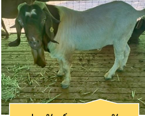
พ่อพันธุ์แพะ 2 ตัว