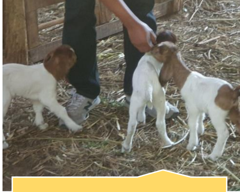
ลูกแพะ 24 ตัว